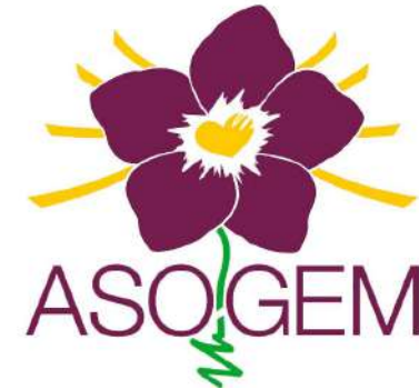
Asociación Guatemalteca de Esclerosis Múltiple - ASOGEM

* A título informativo se indican las principales asociaciones y grupos de pacientes.